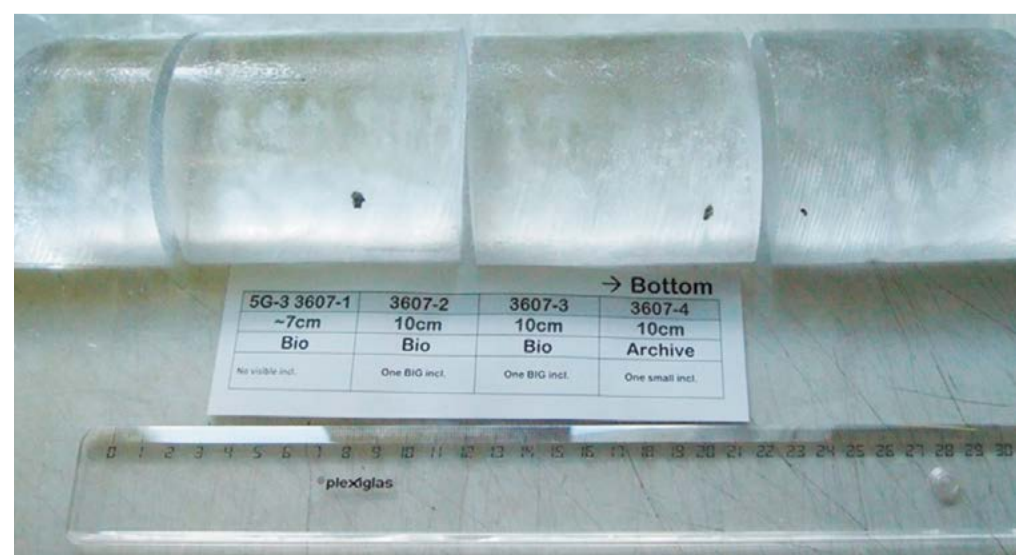
Озерный лед с видимыми включениями, поднятый с глубины 3 607 м